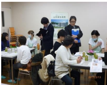
前回の見学会（質疑）の様子

参加申込書をハローワークやまがた「介護・福祉相談コーナー」にお申し込みください。電話でも申し込み可能です。